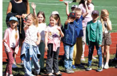
Fanoušci podporovali naše týmy během celého závodu.