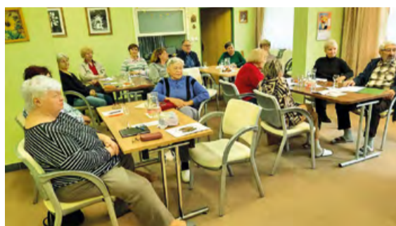
Kapacitu kurzu tréninku paměti jsme zaplnili na 100 %.