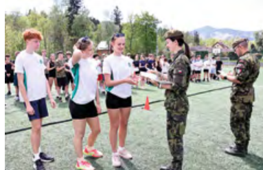
Díky za reprezentaci naší školky.