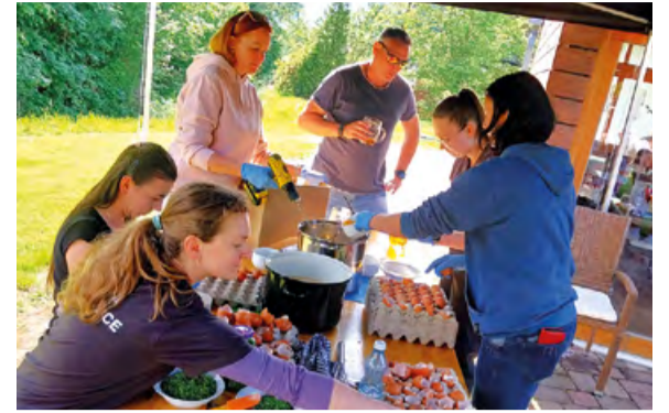
Tradiční akce, která na přelomu května a června zahajuje letní sezónu v obci.