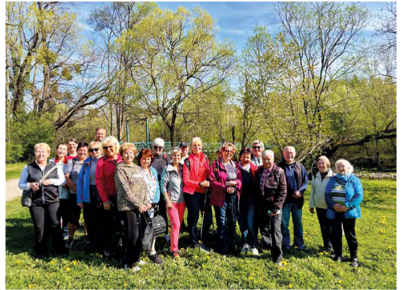
Děkujeme všem, kteří se do výzvy zapojili, a těšíme se na další společné kroky!

Slavnostní vyhlášení nejlepších chodců proběhne v rámci X. Frýdlantských slavností, které se uskuteční 12. června.