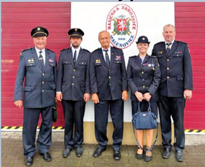
Dne 17. května se zástupci SDH Pstruží zúčastnili slavnostní mše svaté spojené se svátkem sv. Floriána. Každoročně se koná v Malenovicích.