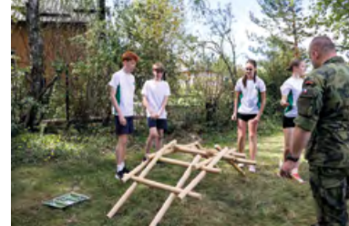
Hurááá – most stojí.