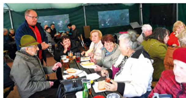
Na stavění májky se nás sešlo 21 a nálada byla výborná.