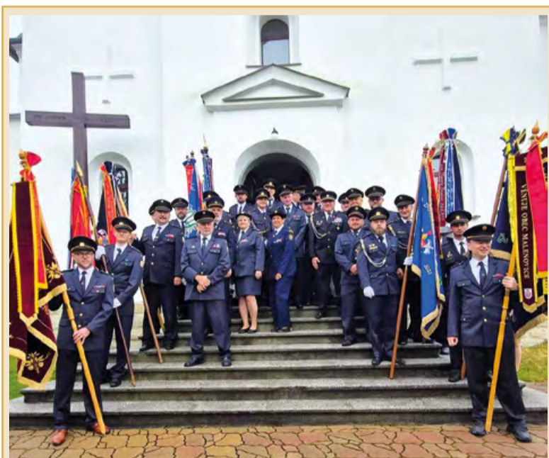
V neděli 17. května se v kostele sv. Ignáce na Borové konala slavnostní mše svatá spojená se svátkem sv. Floriána. Po jejím skončení následoval průvod praporů a hasičů, který byl zakončen v Obecním domě, kde proběhlo přátelské posezení.