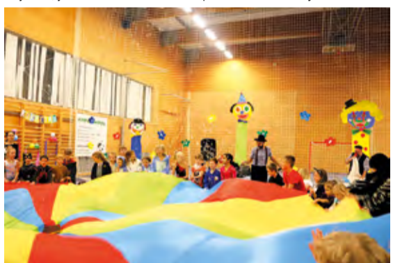
Do karnevalového veselí se zapojili všichni.