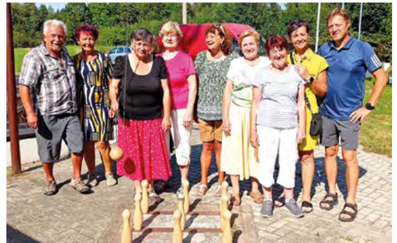
Fotka roku 2025 – na kuželných v Jiskře.

Klubovému únoru samozřejmě vévodilo výroční setkání, nicméně i další akce byly prima. Jinak krom níže uvedených programů probíhaly obvyklé pravidelné akce v klubovně, tzn. zdravotní cvičení obou skupin a úterní karetní posezení. Po uzavření Mikroregionu nás ještě čeká „Oldův svařák“ v klubovně.