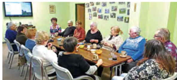
Klubové posezení jen tak.

A třetí čtvrtek únorový jsme se sešli v klubovně k výměně informací všeho druhu, jako obvykle