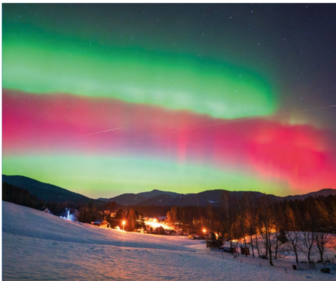
Extrémně silná polární záře nad Lysou horou. Foceno na Lojkaščance 19. ledna ve 22.30. Na záběru osada Chlopčický.