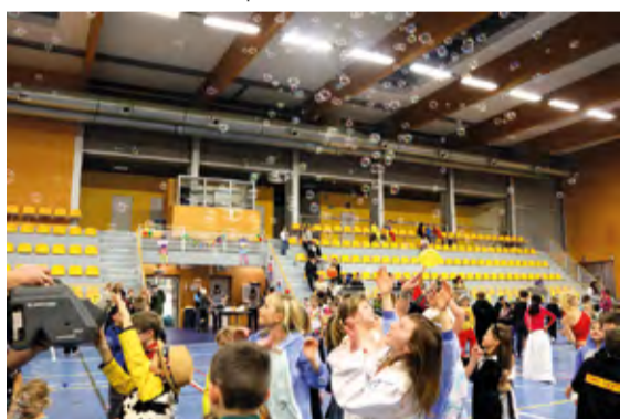
Hurá na bubliny.