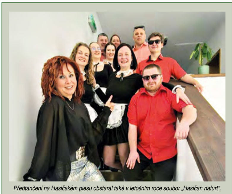
Předtančení na Hasičském plese obstaral také v letošním roce soubor „Hasičan nature“.