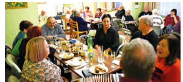
Z výročního setkání.