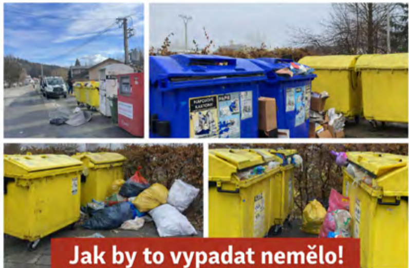
Jak by to vypadat nemělo!